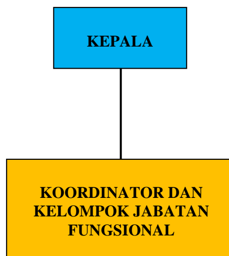
Bagan 1 Struktur Organisasi Loka POM di Kabupaten Pulau Morotai

Struktur organisasi Loka POM di Kabupaten Pulau Morotai dipimpin langsung oleh Kepala Loka. Adapun Kepala Loka membawahi pejabat fungsional seperti pada gambar struktur berikut: