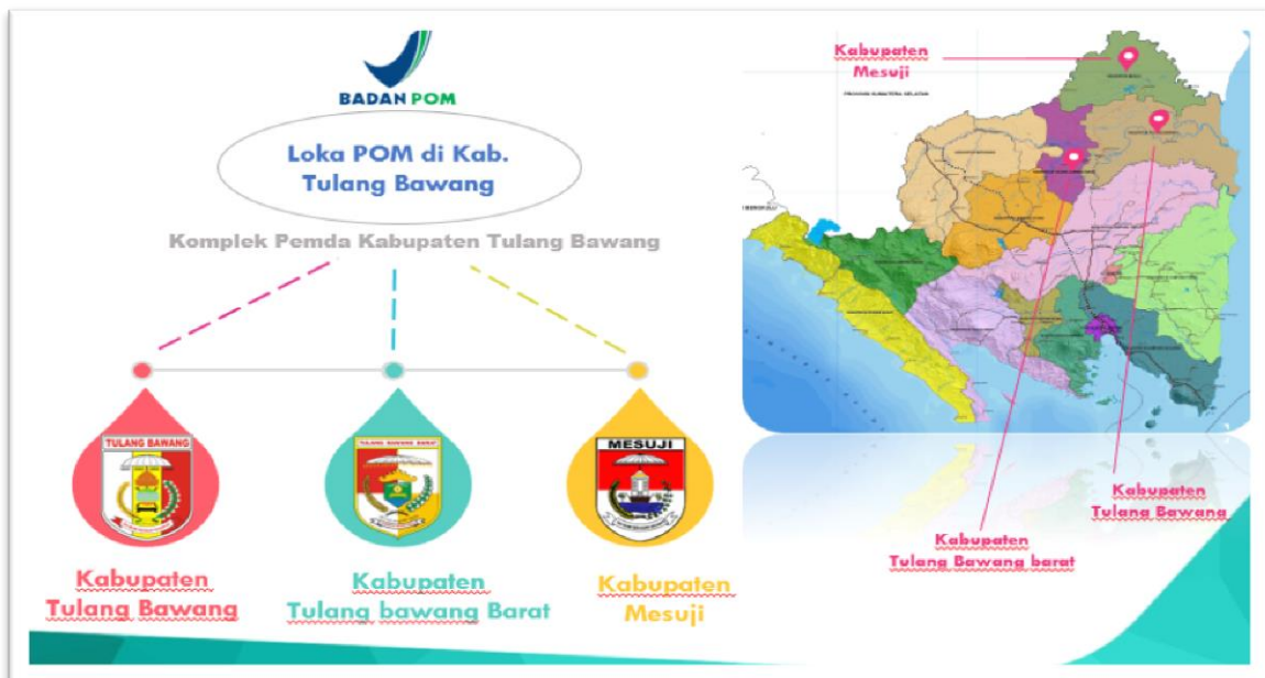
Gambar 2. Wilayah Kerja Loka POM di Kab. Tulang Bawang