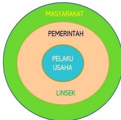
Gambar 4. Tiga Pilar Pengawasan Obat dan Makanan

Dalam menjalankan tugas dan fungsinya, Loka POM di Kabupaten Tulang Bawang tidak dapat berjalan sendiri, sehingga diperlukan kerjasama atau kemitraan dengan pemangku kepentingan lainnya. Dalam era otonomi daerah, khususnya terkait dengan bidang kesehatan, peran daerah dalam menyusun perencanaan pembangunan serta kebijakan mempunyai pengaruh yang sangat besar terhadap pencapaian tujuan nasional di bidang kesehatan. Pengawasan Obat dan Makanan bersifat unik karena tersentralisasi, yaitu dengan kebijakan yang ditetapkan oleh Pusat dan diselenggarakan oleh Balai di seluruh Indonesia. Hal ini tentunya menjadi tantangan tersendiri dalam pelaksanaan tugas pengawasan, karena kebijakan yang diambil harus bersinergi dengan kebijakan dari Pemerintah Daerah, sehingga pengawasan dapat berjalan dengan efektif dan efisien. Pada Gambar dapat dilihat hubungan antara pemerintah, pelaku usaha, dan masyarakat dalam pengawasan Obat dan Makanan.