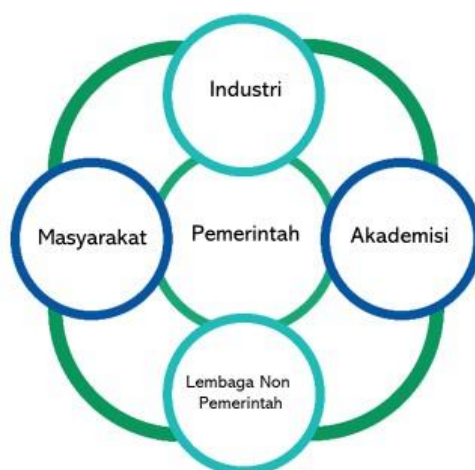
Gambar 5. Penta Helix Pengawasan Obat dan Makanan

Sehingga perlu sinergisme dari lima unsur yaitu pelaku usaha, masyarakat termasuk lembaga non pemerintah, pemerintah, akademisi, media dalam sebuah model yang dinamakan Penta Helix. Model sinergisme ini diharapkan akan menjadi kunci pengawasan Obat dan Makanan yang lebih efektif.