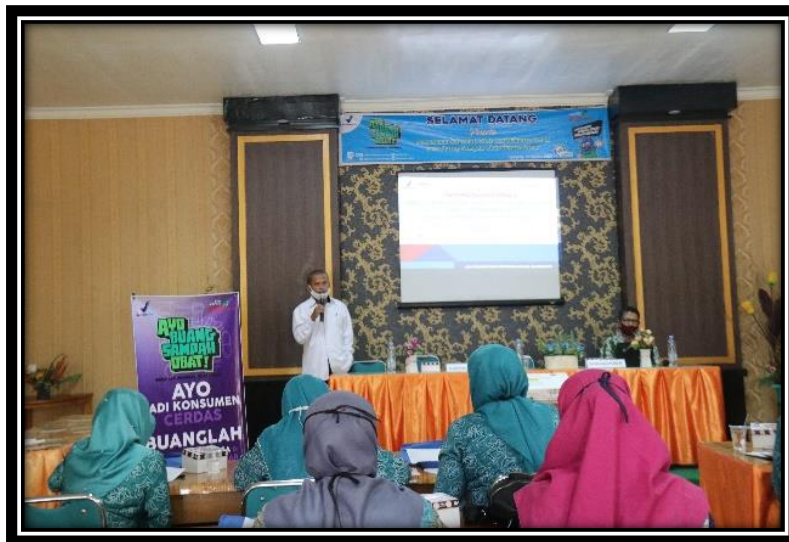
Penyebaran Informasi di Puskesmas Gambok, Kab. Sijunjung

Penyebaran Informasi bertujuan untuk mensosialisasikan gerakan Ayo Buang Sampah Obat dengan Benar. Selain dari Loka POM di Kab. Dharmasraya, juga diberikan materi dari Dinas Kesehatan Kab. Sijunjung.