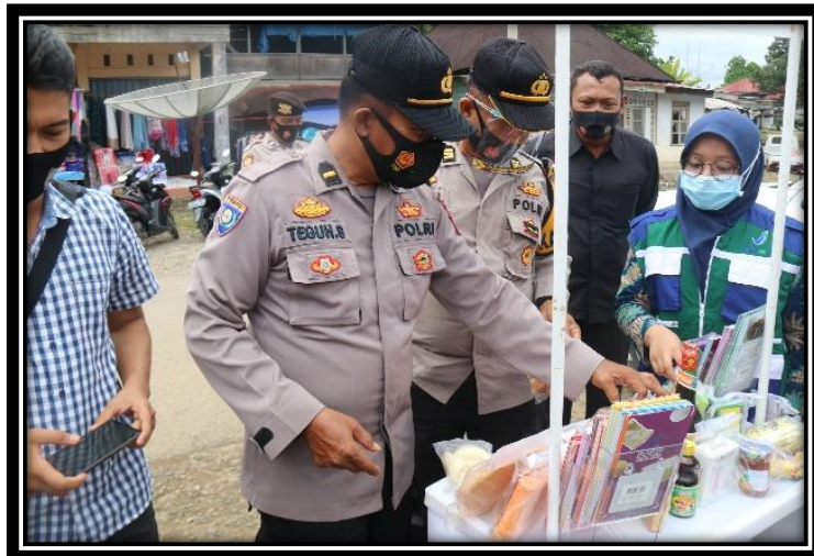
Pos Pelayanan Terpadu Loka POM di Kab. Dharmasraya

Pos pelayanan terpadu merupakan salah satu layanan yg diberikan Loka POM di Kabupaten Dharmasraya kepada masyarakat. Menggunakan mobil keliling, stand di buka di setiap pasar yang ada di Kabupaten Dharmasraya dan Kabupaten Sijunjung, dengan menampilkan contoh produk-produk tanpa izin edar (TIE), produk terdaftar dan makanan yang mengandung bahan berbahaya. Turut di sosialisasikan penggunaan Aplikasi Cek BPOM dan Cek KLIK. Masyarakat juga bisa menanyakan berbagai hal tentang makanan