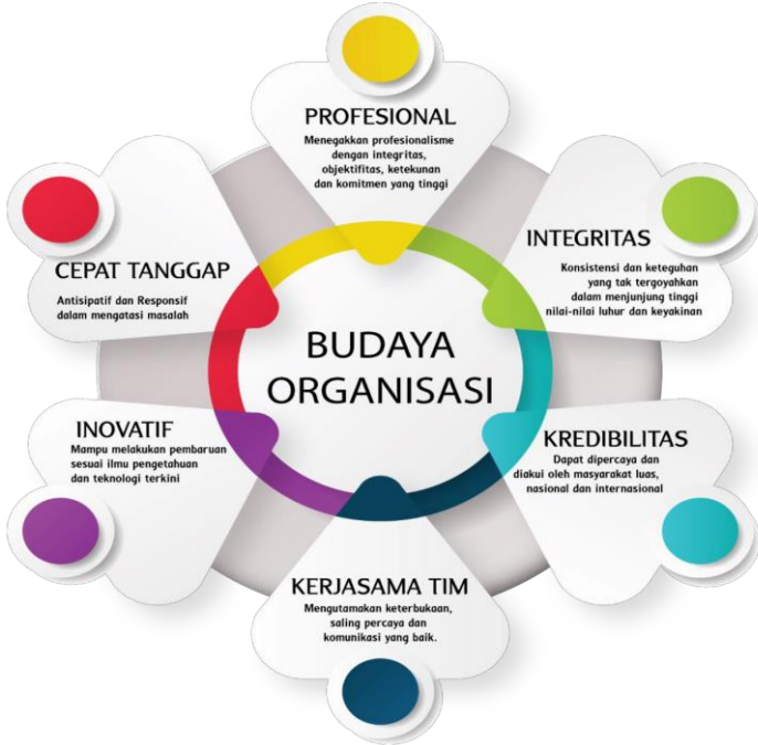
Gambar 1.2 Budaya Organisasi

tugasnya. Nilai-nilai luhur yang hidup dan tumbuh-kembang dalam BPOM menjadi semangat bagi seluruh anggota BPOM.