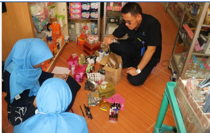
Temuan Produk TIE dan Kadaluarsa

Pada tahun 2020 Indonesia termasuk Negara yang diikutsertakan dalam kegiatan Operasi Pangea XIII. Pelaksanaan Operasi Pangea XIII di Indonesia dilakukan secara terpadu oleh Badan POM, Kepolisian RI, Direktorat Jenderal Bea Cukai dan instansi-intansi lain yang terkait. Badan POM khususnya Loka POM di Kabupaten Dharmasraya, ikut andil dalam kegiatan Operasi Pangea XIII ini. Operasi Pangea merupakan operasi internasional yang dilakukan dibawah koordinasi Interpol. Pada kegiatan tersebut berfokuskan terhadap pelaksanaan memutus system distribusi obat ataupun kosmetik illegal melalui media internet. Operasi Pangea XIII ini Loka POM di Kabupaten Dharmasraya melakukan secara bersama-sama dengan kepolisian daerah Kabupaten Dharmasraya.