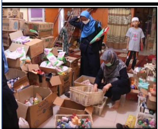
Operasi Penindakan terhadap Sarana Toko Obat

Dalam menjalankan tugas dan fungsi Badan POM berdasarkan Perpres Nomor 80 Tahun 2017 tentang Badan Pengawas Obat dan Makanan. Pada tanggal 28 September tahun 2020 fungsi penindakan Loka POM di Kabupaten Dharmasraya melakukan operasi penindakan terhadap sarana berupa Toko Obat, dimana Toko Obat tersebut melakukan praktik kefarmasian Tanpa Keahlian dan Kewenangan. Kegiatan Operasi Penindakan ini dilakukan oleh petugas Loka POM di Kabupaten Dharmasraya bersama-sama dengan petugas dari Balai Besar POM di Padang dan didampingi oleh petugas Kepolisian dari Polda Sumbar.