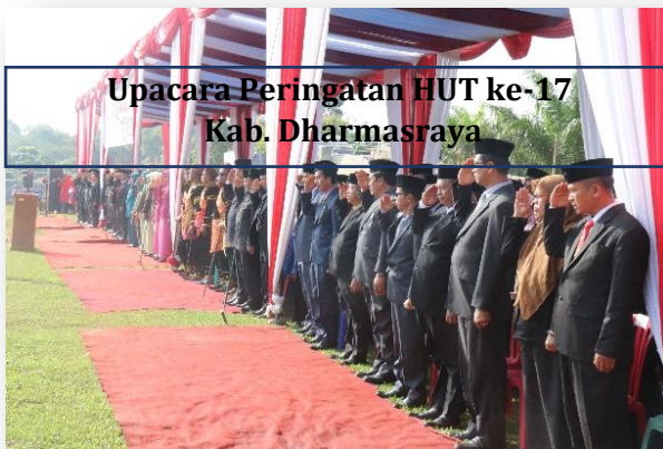
Upacara Peringatan HUT ke-17 Kab. Dharmasraya

Peringatan Hari Ulang Tahun Kabupaten Dharmasraya ke 16 di peringati dengan berbagai agenda acara antara lain Upacara, Sidang Paripurna, Pameran, Lomba-Lomba dan lain-lain. Sidang Paripurna diikuti oleh seluruh anggota DPRD Kabupaten Dharmasraya, Pejabat Kabupaten mulai dari Kepala OPD, Kepala Bagian, Asisten, Camat, Walinagari dan seluruh lapisan masyarakat.