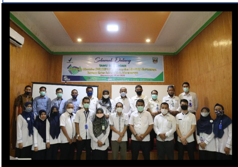
FGD ( Focuss Group Discussion ) BBPOM di Padang dan Loka POM Dharmasraya Bersama Lintas Sektor di Kab. Dharmasraya

Pada kesempatan ini disampaikan progress tanah hibah yang telah diberikan Pemerintah Kab. Dharmasraya untuk pembangunan Kantor Loka POM di Kab. Dharmasraya, sekaligus silaturahmi dengan lintas sector yang ada.