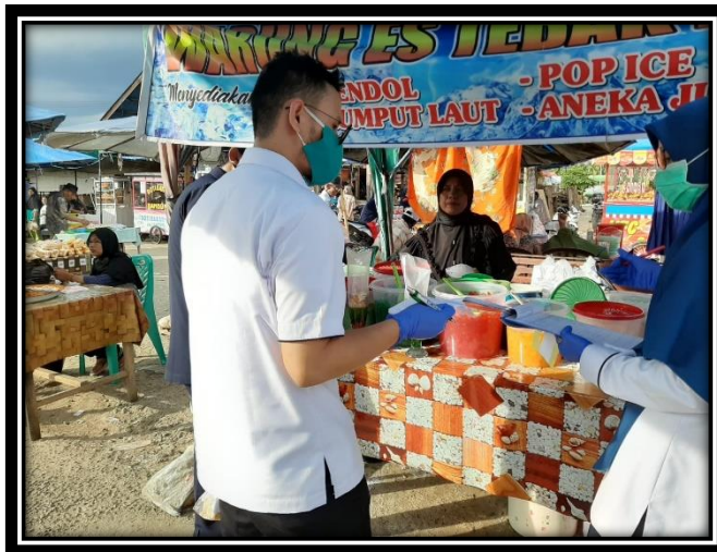
Pengawasan Pabukoan / Takjil

Pada kesempatan ini, selain dilakukan sampling pabukoan, juga dilakukan penyuluhan dan pemberian masker kepada pedagang.