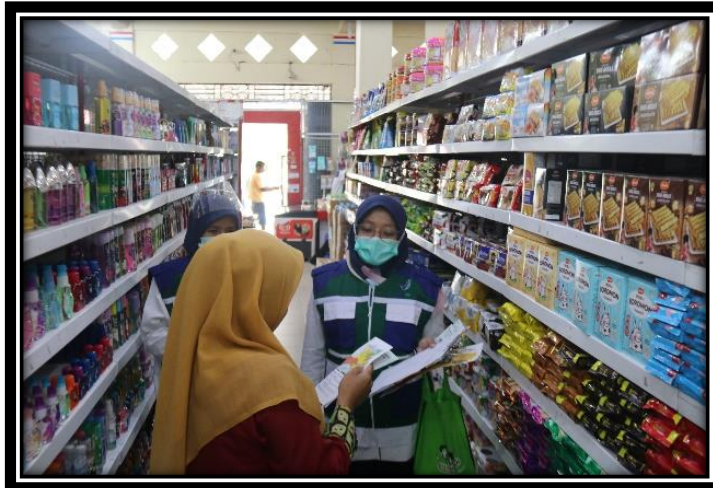
Sosialisasi Ayo Ceklik Sebelum Belanja di Sarana Ritel

Diharapkan dengan adanya kegiatan ini, masyarakat menjadi konsumen yang cerdas sebelum berbelanja. Cek Kemasan, Cek Label, Cek Izin Edar dan Cek Kadaluarsa.