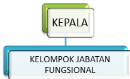
Gambar 1.1 Struktur Organisasi Loka POM

Berdasarkan Peraturan Badan Pengawas Obat dan Makanan Nomor 12 Tahun 2018 bahwa tugas Loka POM adalah melakukan inspeksi dan sertifikasi