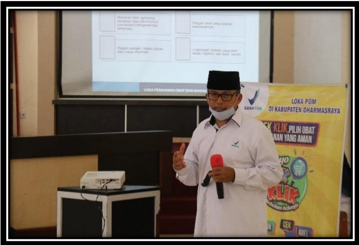
Penyebaran Informasi di Aula Kantor Bupati Kab. Dharmasraya

Dalam rangka memperingati Hari Keamanan Pangan Dunia, dilakukan Penyebaran Informasi dengan tema Keamanan Pangan di Sarana Ritel pada Era New Normal. Kegiatan yang dilakukan pada masa pandemic Covid-19, harus menerapkan protocol kesehatan yaitu menjaga jarak antar peserta, memakai masker dan mencuci tangan. Pada kesempatan ini, Penyebaran Informasi dilakukan di Aula Kantor Bupati Dharmasraya, dengan mengundang pelaku usaha yang memiliki sarana ritel di Kecamatan Pulau Punjung, Kab. Dharmasraya.