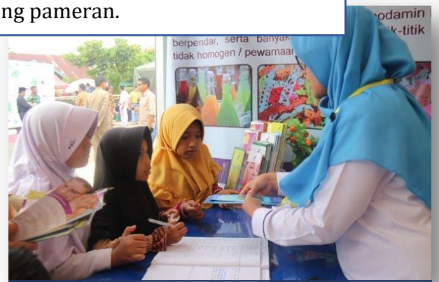
KIE melalui Pameran

Selain itu, Loka POM di Kabupaten Dharmasraya juga ikut serta dalam Pameran yang diadakan dari tanggal 17 Februari – 20 Februari 2020, melalui pengenalan bahan berbahaya pada makanan, contoh produk tanpa izin edar (TIE) dan produk terdaftar kepada masyarakat pengunjung pameran.