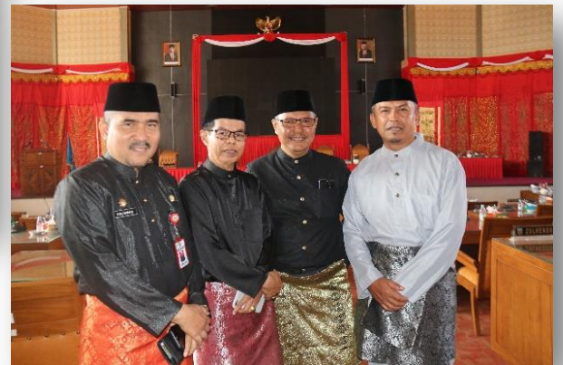
Sidang Paripurna dalam Rangka HUT- 17 Kab. Dharmasraya