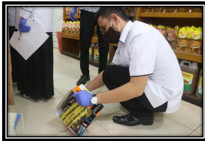
Temuan Produk TIE dan Kadaluarsa

Intensifikasi pengawasan pangan ini dilakukan setiap minggu dalam 5 tahap, dengan rentang waktu dari tanggal 27 April – 22 Mei 2020.