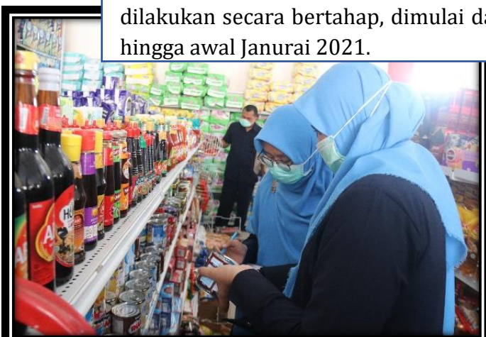
Intensifikasi Pangan menjelang Hari Raya Natal dan Tahun Baru 2020

Dalam rangka melindungi kesehatan masyarakat dari peredaran produk pangan dan yang tidak memenuhi ketentuan khususnya menjelang Hari Raya Natal dan Tahun Baru 2020. Loka POM di Kabupaten Dharmasraya melakukan intensifikasi pengawasan pangan tanpa izin edar (TIE), kedaluwarsa dan rusak (penyok, kaleng berkarat, dan lain-lain) pada semua distribusi pangan (import/distributor toko, supermarket, hypermarket, serta pembuat dan atau penjual parcel). Intensifikasi pengawasan pangan ini dilakukan secara bertahap, dimulai dari pertengahan bulan Desember 2020 hingga awal Januari 2021.