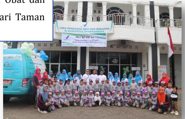
Pemberian Edukasi kepada siswa/i Taman Kanak Kanak

Dalam rangka memeriahkan HUT Badan POM RI yang ke – 19, Loka POM di Kabupaten Dharmasraya mengadakan acara perlombaan sekaligus pemberian edukasi Obat dan Makanan Aman dengan mengundang siswa/i dari Taman Kanak-Kanak.