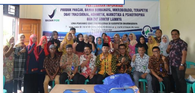
Penyebaran Informasi Keamanan Pangan

Penyampaian informasi tentang keamanan pangan diikuti oleh pedagang yang ikut dalam Traditional Street Food di Kabupaten Dharmasraya. Materi disampaikan langsung oleh Kepala Loka POM di Kabupaten Dharmasraya, selain itu juga dihadiri oleh Dinas Kesehatan, Dinas Pangan, Dinas Perdagangan, Dinas Lingkungan Hidup dan Dinas Pertanian di Kabupaten Dharmasraya.