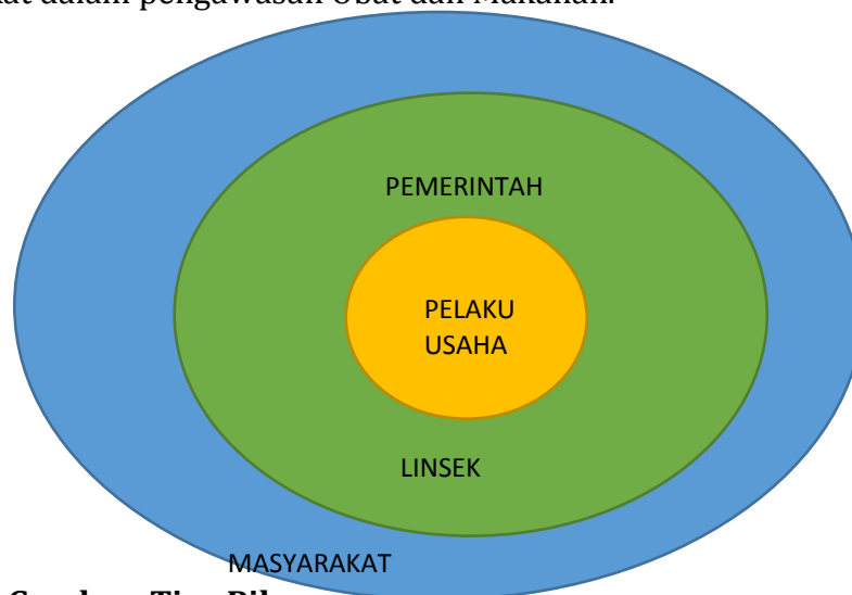
Gambar 2.1 Gambar Tiga Pilar